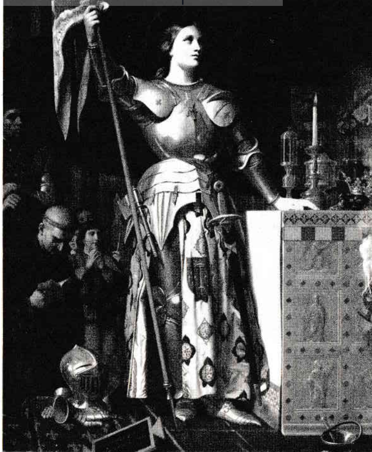
Ioana d'Arc în capela regelui Carol al VII-lea