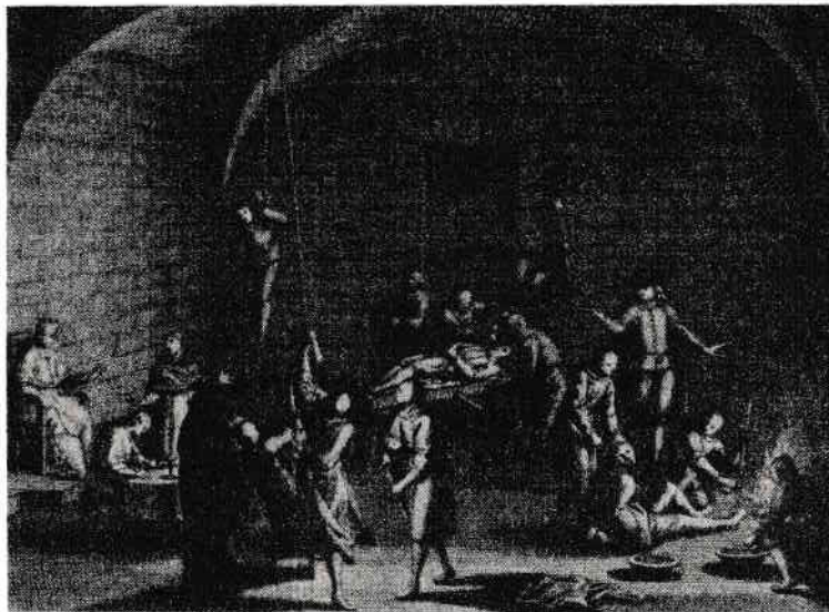
Camera de tortură a Inchiziției